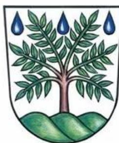
Obec Deštné v Orlických horách